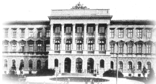
Головний корпус Львівської політехніки

Національний університет "Львівська політехніка" Колегія та профком студентів і аспірантів Рада молодих вчених